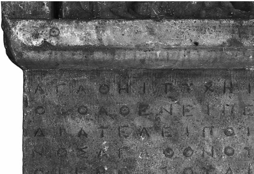
Εικ. 3. Λεπτομέρεια τοῦ ἰωνικοῦ κυματίου με φθορισμὸ ὑπεριώδους ἀκτινοβολίας (UVF)