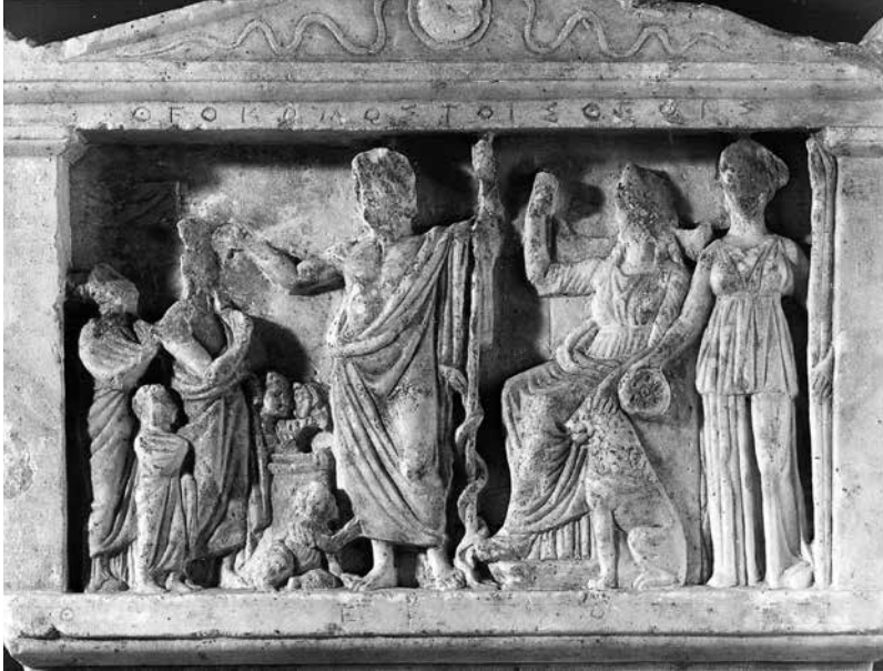
Εικ. 2. Τὸ ἐπίτιτλο ἀνάγλυφο τοῦ ψηφίσματος (ΕΑΜ 6587)