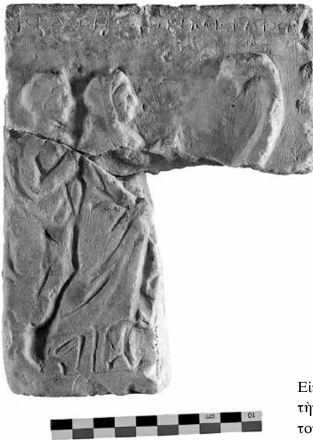
Εικ. 5. Αναθηματικό ανάγλυφο ἀπὸ τὴν ἀνασκαφὴ τοῦ Μ. Μισοῦ νοτίως τοῦ Ὀλυμπείου (EAM 12194)