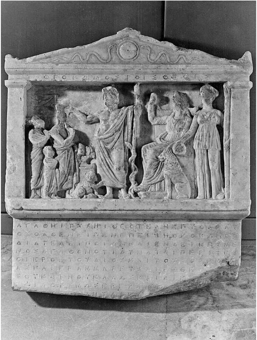
Εικ. 1. Τὸ ψήφισμα ὀργεῶνων (ΕΑΜ 6587)